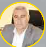
صمدر سولوی بنیس شرکت درنا شخصیت صنعت غذای سال ۱۳۹۷