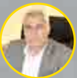
صمدر سولوی بنیس شرکت درنا شخصیت صنعت غذای سال ۱۳۹۷